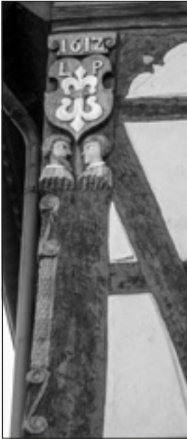
Abb. 2: Von Handwerkern kunstvoll verziertes Pfreundschild-Wappen am „Engel“ in Hochhausen (Tauber) Vorlage: Dr. Gerhard Pfreundschuh

schleppten Seuchen ein: 1635 wütete die „Rote Ruhr“ und 1636 vernichtete die Pest ganze Ortschaften 44 .