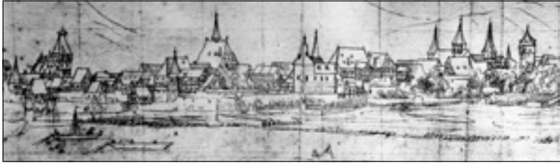
Abb. 1: Älteste Eberbacher Stadtansicht von 1619

oder Bankleute. Laut Hansmartin Schwarzmaier war Eberbach eine Kleinstadt „mit einem nicht hohen, durchschnittlichen Lebensstandard“ 9 . Trotzdem sieht man auf einer Abbildung von 1619 eine ummauerte Stadt mit Türmen und ansehnlichen Fachwerkgebäuden 10 .