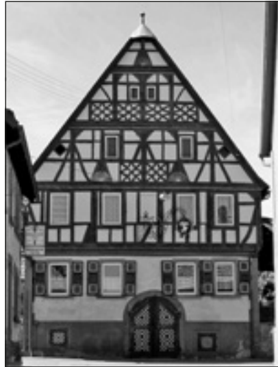
Abb. 3: Das Fachwerkhaus („Engel“) in Hochhausen (Tauber) aus dem Jahre 1612 als Beispiel für die Handwerkskunst vor dem 30-jährigen Krieg (1618–1648)

Wenn es den Soldaten so elend ging, wie viel schlimmer muss es für Bewohner gewesen sein. Endlich kam es 1648 in Münster und Osnabrück zum Westfälischen Frieden. Die Bevölkerungsverluste waren örtlich unterschiedlich. In Franken und der Kurpfalz sollen sie bei 50 % bis 70 % gelegen haben 50 . In den deutschen Alpenländern gab es keine, in Nordwestdeutschland wenig Bevölkerungsverluste.